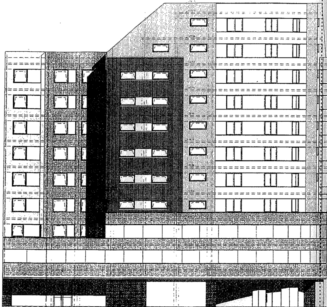
FATADA B-DUL OCTAVIAN GOGA SC1/200