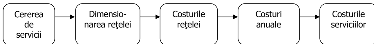
Figura nr. 1: Structura generală a modelului de calculație a costurilor

38. Modelul existent, dezvoltat pentru a determina costurile furnizării mai multor servicii de comunicații electronice la nivel de gros 16 , a fost actualizat exclusiv în scopul determinării costurilor eficiente ale furnizării serviciului de terminare la puncte fixe. Astfel, pentru a nu afecta funcționalitatea modelului, nu a fost eliminat, dar nici actualizat scenariul PSTN/SDH al operatorului specific, ci doar datele de intrare și ipotezele pentru scenariul NGN / operatorul generic . În acest scop, au fost utilizate date statistice aflate la dispoziția ANCOM, precum și răspunsurile furnizate de operatorul fost monopolist de comunicații electronice din România la solicitarea de informații transmisă de ANCOM.